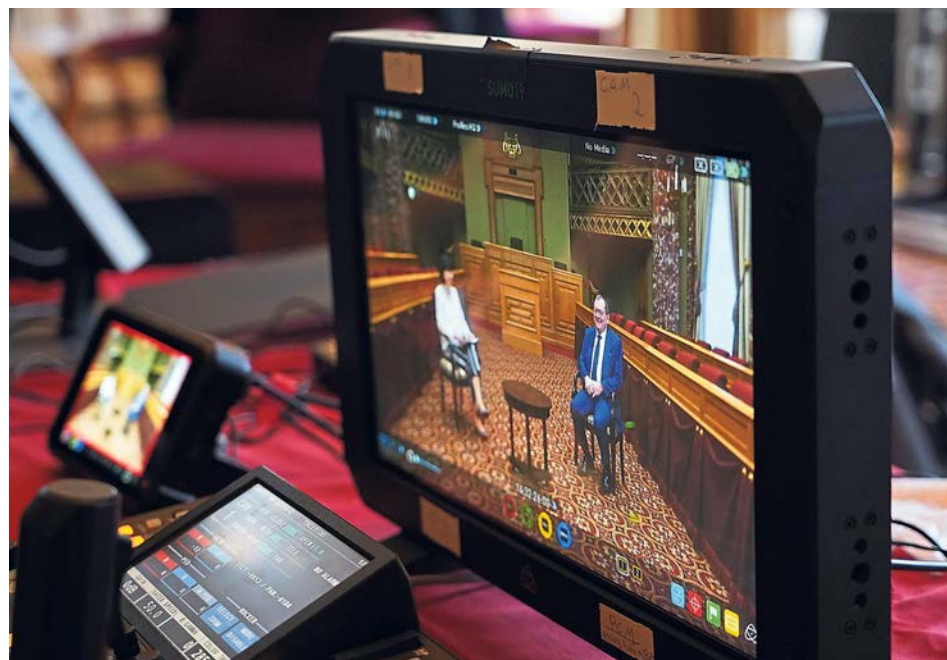
L'interview donnée par M. le Président pour le Nouvel An est retransmise sur Chamber TV et peut être consultée sur www.chd.lu .

Il est évident que les traditionnelles prises de parole du Nouvel An du Président de la Chambre des Députés étaient différentes des autres années, dans la mesure où la crise sanitaire de la Covid-19 a aussi bien marqué la forme que le contenu des messages de début d'année.